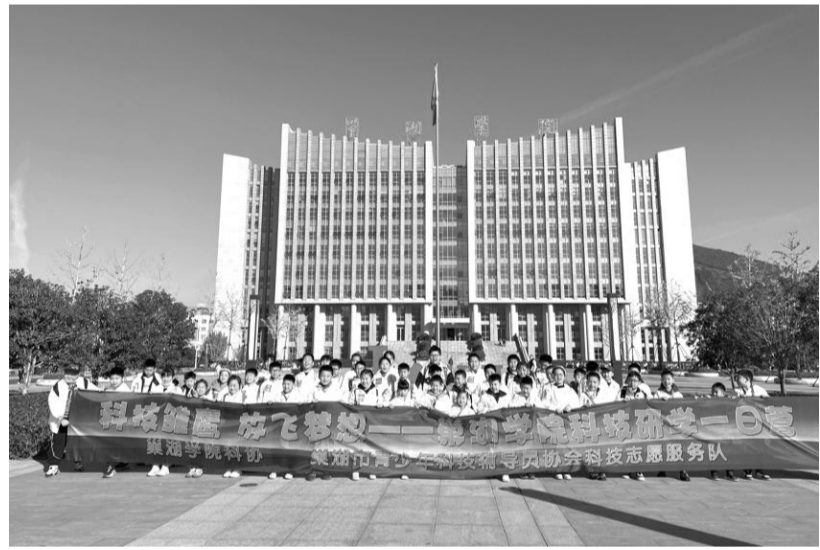
11月18日,巢湖学院科协联合巢湖市科协、巢湖市青少年科技辅导员协会科技志愿服务队共同开展“科技雏鹰,放飞梦想”巢湖学院科技研学一日营活动。来自巢湖市多所小学的50名同学参加,由巢湖学院科协组织安排化学与材料工程学院、机械工程学院、电子工程学院、旅游管理学院的老师和大学生志愿者提供参观讲解和实践指导。此次研学营的成功举办,是巢湖学院科协的一次创新尝试,为巢湖市青少年提供一个新的科普营地。(文/张平改)