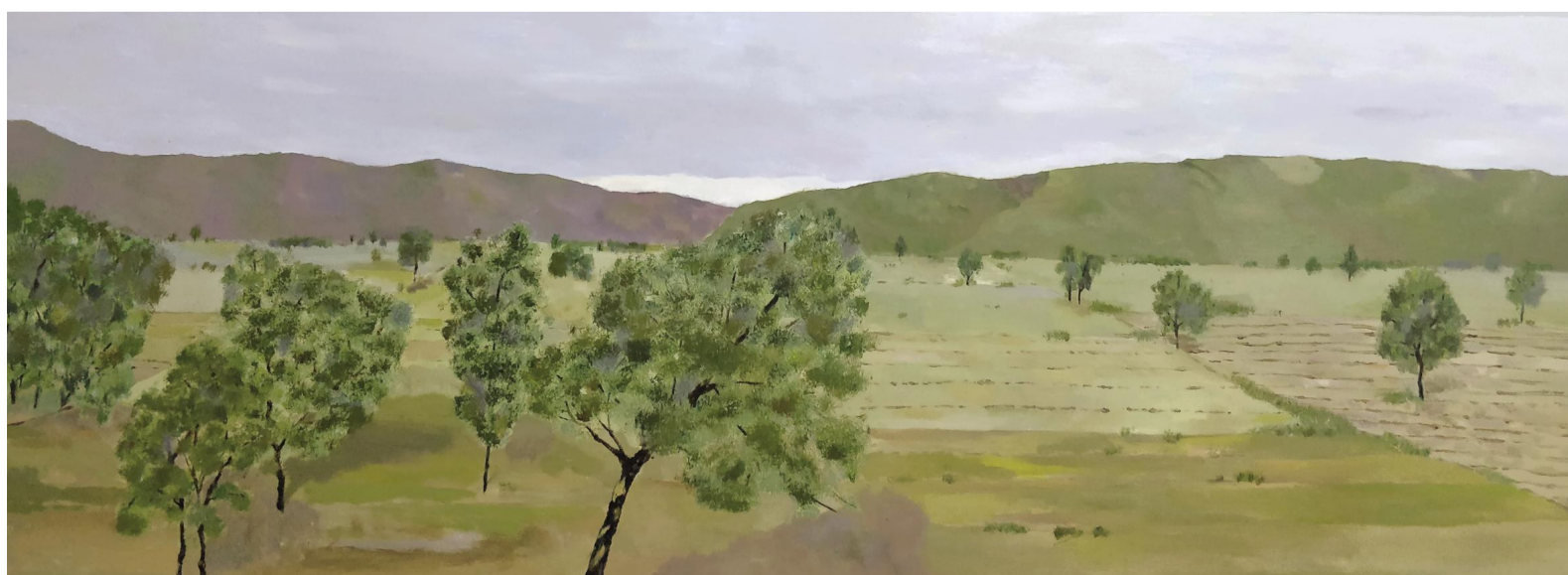
《远方的田野》 李隆博 指导教师:贾昌娟