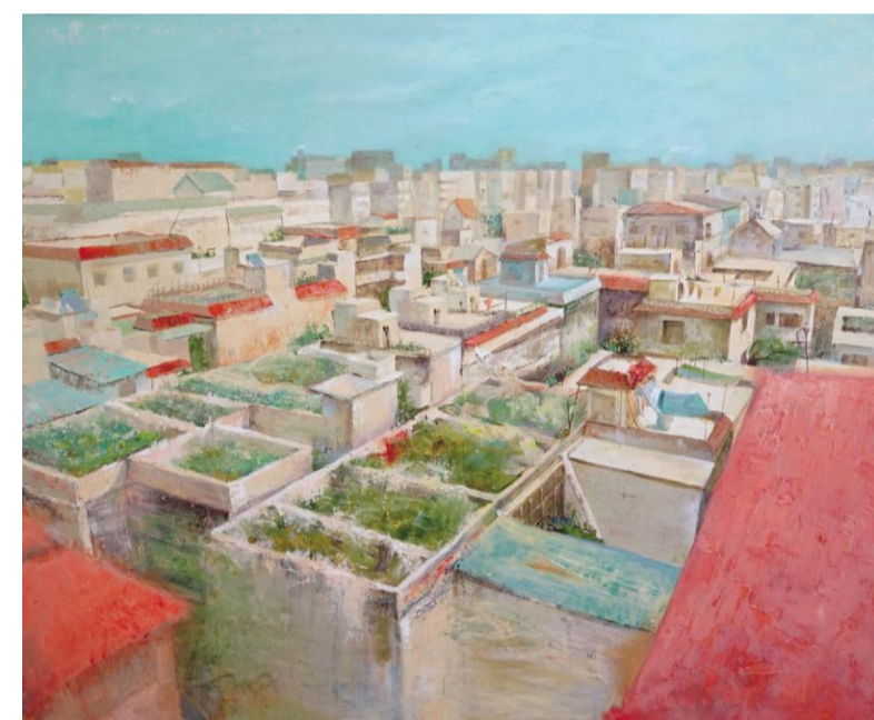
《俯瞰“月蓝湾”》 刘一帆 指导教师:孔慧