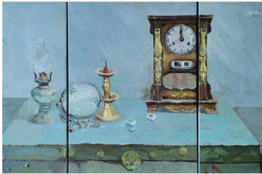
《时光》 吴智园 指导教师:席景霞