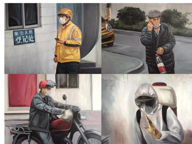
《疫行》 檀磊 指导教师:曹多军