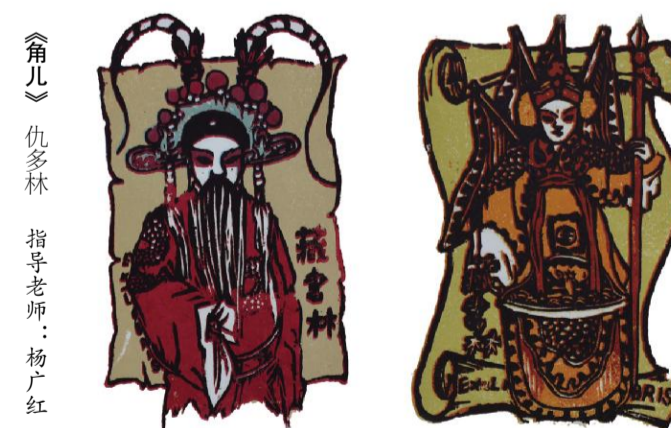
《角儿》 仇多林 指导老师:杨广红