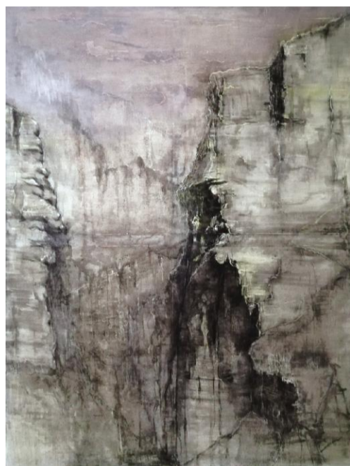
《山石》 魏程 指导老师:黄玮