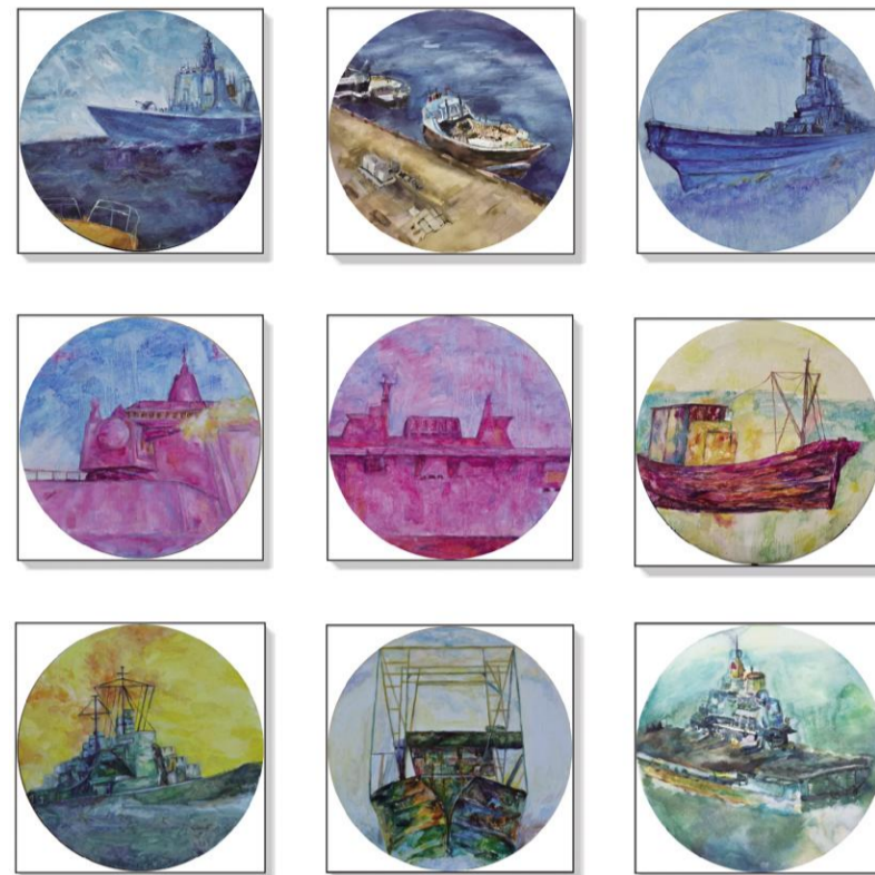
《中国梦·船》 崇雅琴 指导教师:李超峰