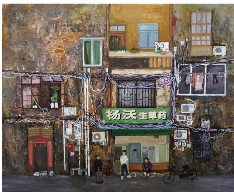
《时光荏苒》 郑超 指导教师:秦艳