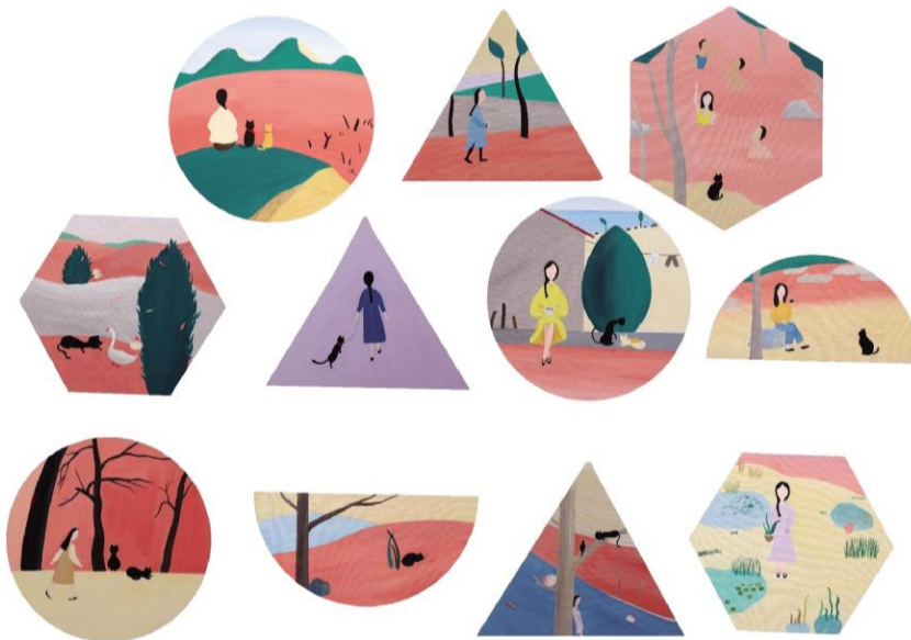
《舞》 苏爱帆 指导教师:崔寅