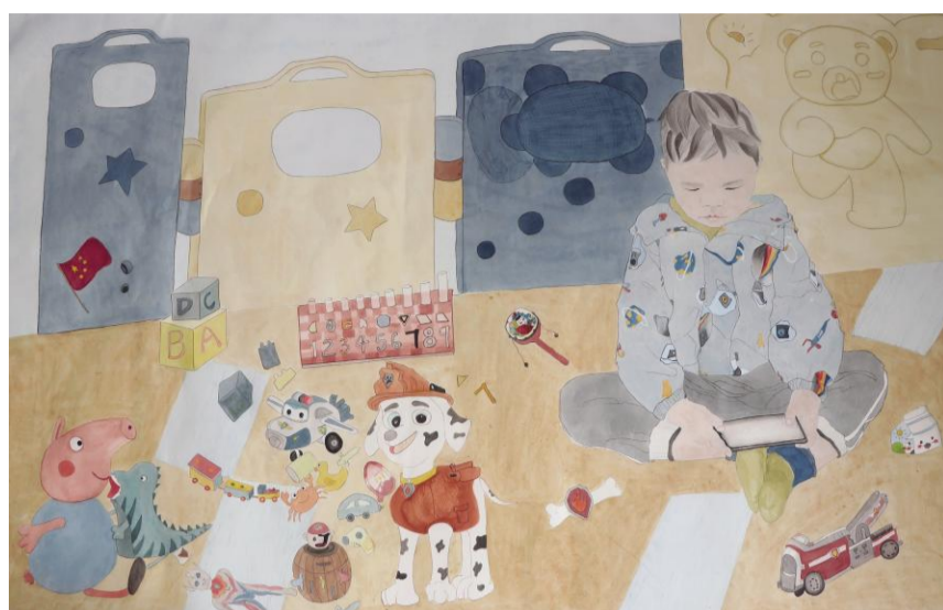
《童趣》 杨钰琼 指导老师:王晓晖