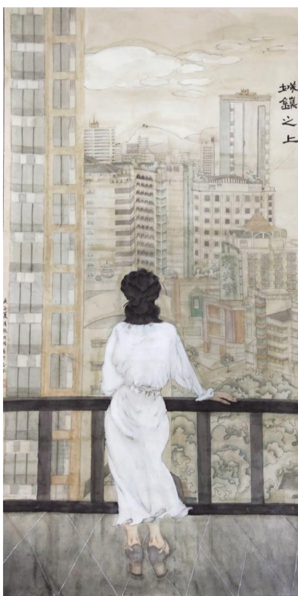
《城镇之上》 张文倩 指导教师:刘靖宇