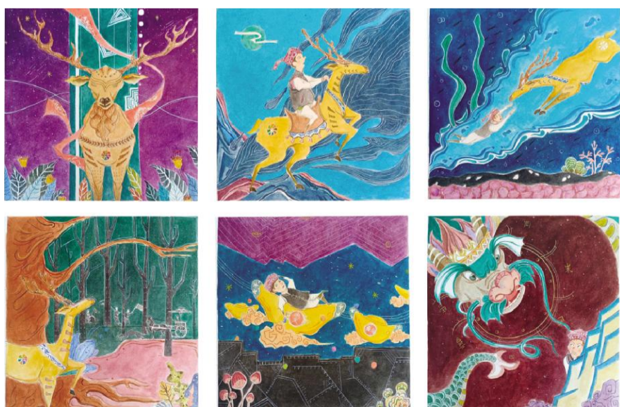
《鹿王本生传》 白锦涛 指导教师:李超峰