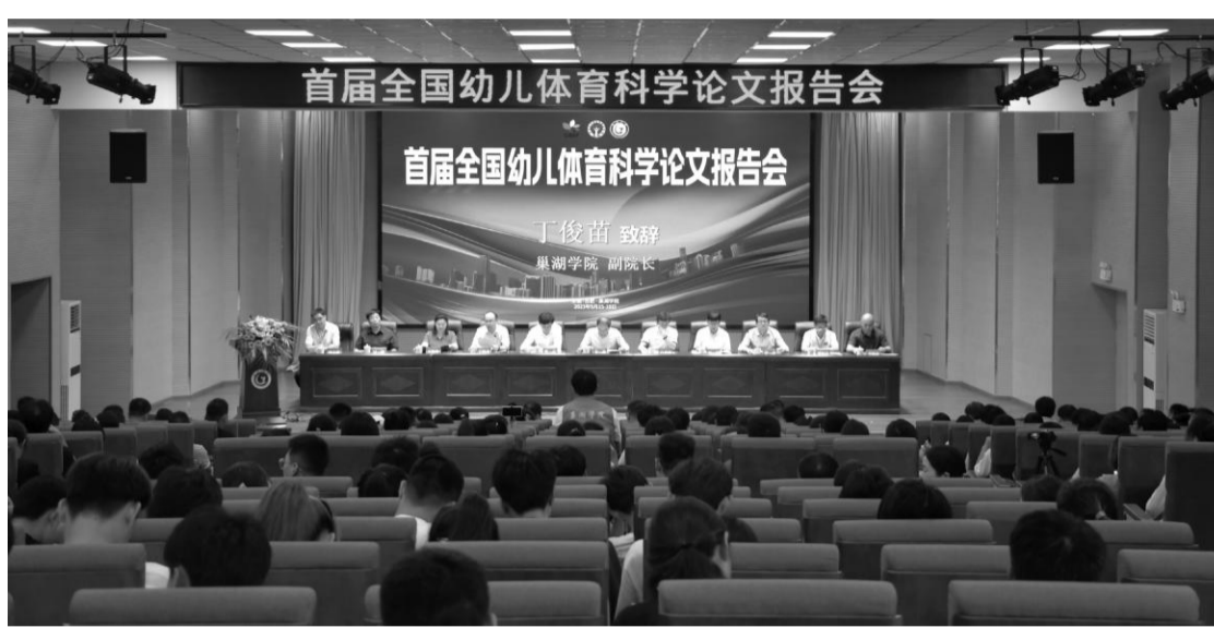
首届全国幼儿体育科学论文报告会在我校召开

在大会主旨报告会上,北京理工大学儿童青少年卫生研究所教授、博士生导师、所长马军,中国教育科学研究院体育美育教育研究所研究员、所长吴健,教育部全国高等学校体育教学指导委员会委员兼公共体育学科组组长胡振浩,首都体育学院原副校长、全国体育运动学校联合会幼儿体育分会会长王凯珍,中国教育科学研究院体育美育教育研究所所长吴健,教育部全国高等学校体育教学指导委员会委员兼公共体育学科组组长胡振浩,首都体育学院原副校长、全国体育运动学校联合会幼儿体育分会副秘书长李晓佳出席开幕式。开幕式由首都体育学院身体运动功能训练研究所所长、博士生导师周志雄主持。